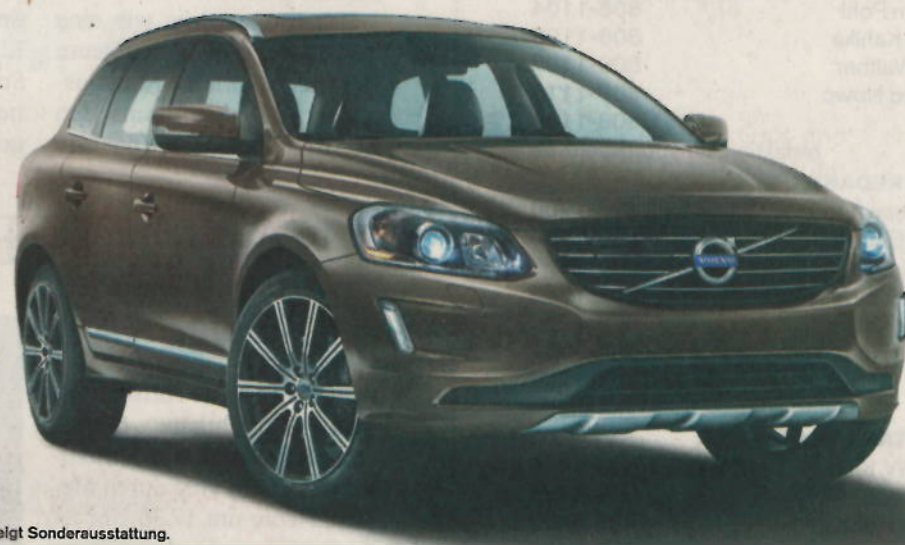
Abb. zeigt Sonderausstattung.